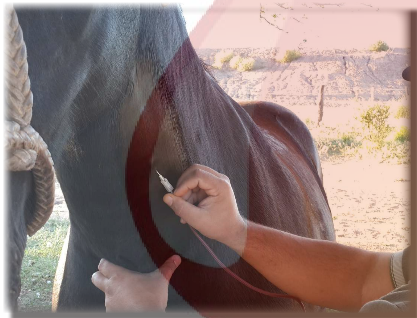
Extracción de sangre en equino.

El requerimiento de sangre de distintas especies para la preparación de medios de cultivo destinado al diagnóstico de enfermedades producidas por bacterias en medicina humana y animal es constante. Uno de los inconvenientes mayores radica en que, considerado como aditivo a los medios, tiene una durabilidad muy corta (alrededor de 90 días) lo que lleva a la necesidad de extraer periódicamente sangre de los animales para este uso. La sangre debe mantener características que propicien el desarrollo bacteriano como la ausencia de microorganismos contaminantes, la ausencia de anticuerpos contra las especies más comunes que infectan a los animales y al hombre, la ausencia de tratamiento antimicrobiano (tanto oral como parenteral) como así también certificar que los animales dadores están sanos y libres de enfermedades zoonóticas. Por otro lado, es necesario contemplar el bienestar animal, lo que implica no sólo su cría, mantenimiento y manejo, sino disminuir al mínimo el stress que implica la extracción de volúmenes de sangre en forma periódica. Esto debe analizarse desde lo económico como un costo beneficio, a mayor bienestar podría generar mayor costo de producción.